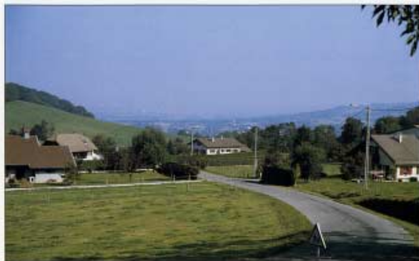
Vue du Col du Mont Sion